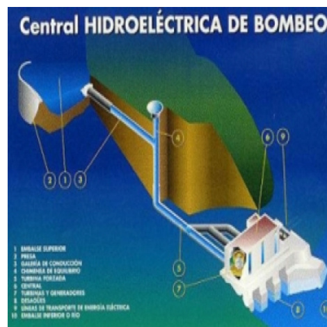
Hidroeléctrica que abastece a la comunidad de Los Calabazos

Con la ayuda de la Junta del Yaque (organismo regional de cooperación), la Agencia de los Estados Unidos para el Desarrollo (USAID), la Universidad Agroforestal Fernando Arturo de Meriño (UAFAM) y otras instituciones de cooperación, los residentes de la comunidad Los Calabazos y del club de Madre Nueva Esperanza hemos instalado el primer generador hidroeléctrico que ofrece energía durante las 24 horas del día, a un costo promedio de RD$75 por mes (las viviendas con electrodomésticos de alto consumo deben pagar RD$100).